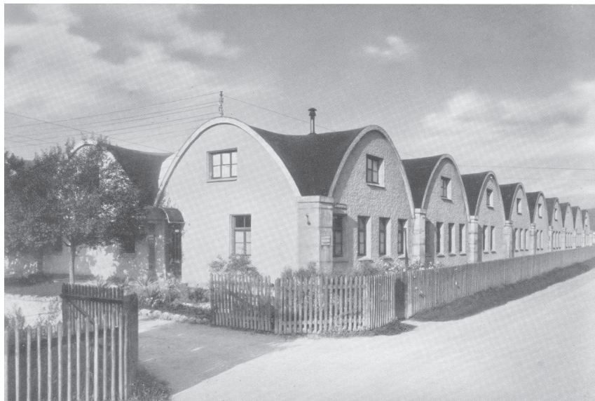
Das Firmengebäude der Haas'schen Schriftgießerei in Münchenstein