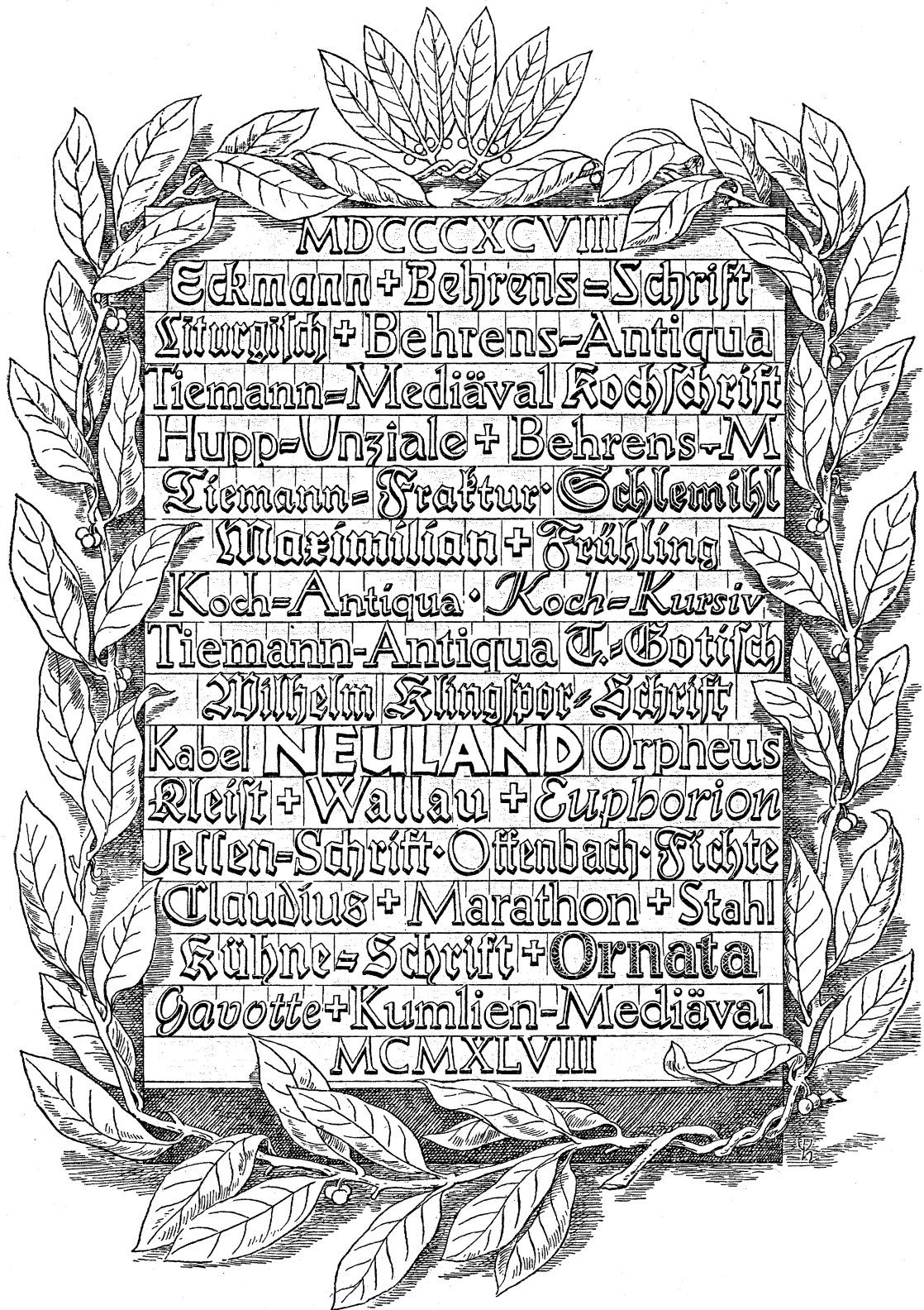
Abbildung aus: Festschrift – Karl Klingspor zum achtzigsten Geburtstag am 25. Juni 1948. Offenbach 1948