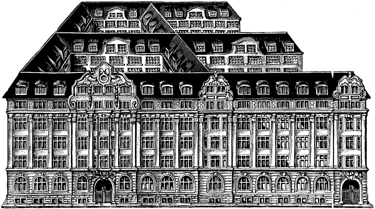
Schriftgießerei D. Stempel AG, Vorderansicht