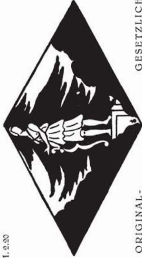
38173 M. 2.50