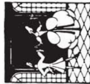
38156 M. 1.80