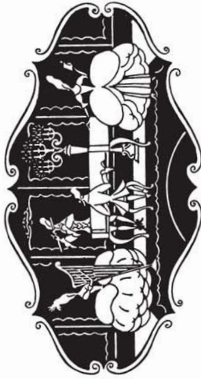
38178 M. 2.80