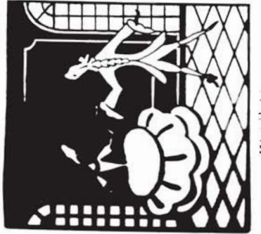
38179 M. 3.20