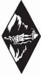
38171 M. 1.80