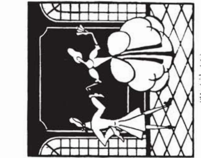
38179 M. 3.20