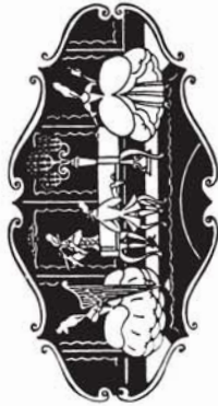
38177 M. 2.50