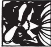
38148 M. 9