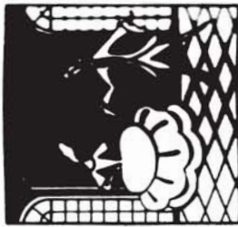
38162 M. 2.20