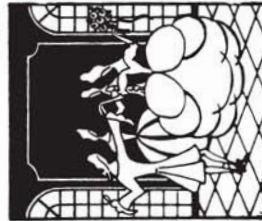
38161 M. 2.20