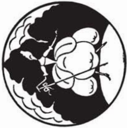
38145 M. 2.20