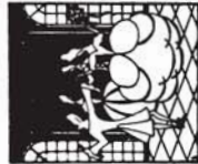
38157 M. 1.80