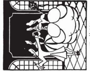
38179 M. 3.20