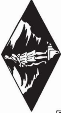
38172 M. 2.90