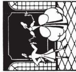
38160 M. 2.20