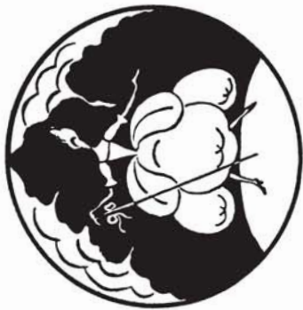
38146 M. 2.50

NACH ZEICHNUNGEN VON HILDEGARD SORESENSEN