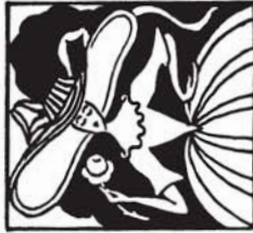
38149 M. 2.20