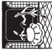
38158 M. 1.80