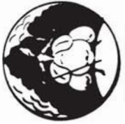
38147 M. 1.80