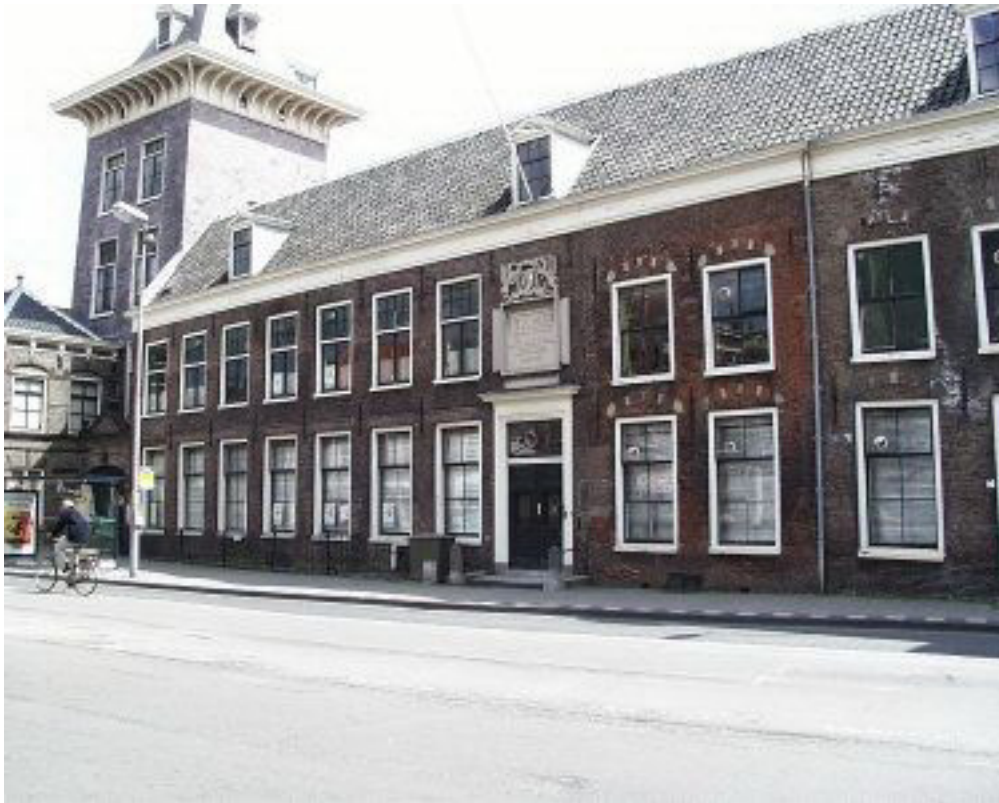
Das frühere Haus Enschedé in der Klokhuisplein

Museum Joh. Enschedé en Zonen im Internet: http://www.museumenschede.nl