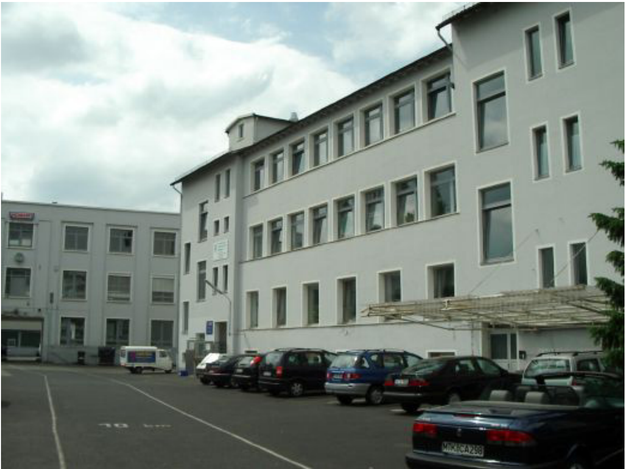
Die Firma Gebr. Klingspor nach dem 2. Weltkrieg